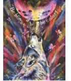
Art Studio Yuki YUKI TANIDA(滋賀県)